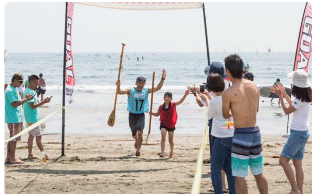
白熱するマーク旋回と感動のゴールシーン