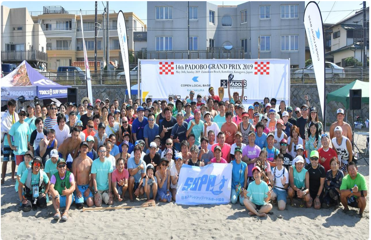
2019年5月に開催された前回大会の様子