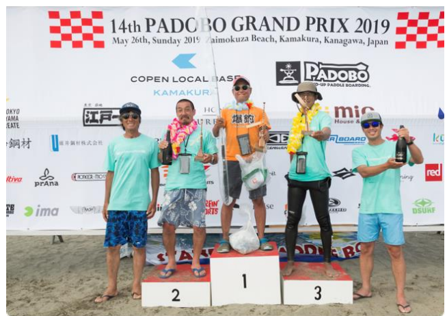
フィッシングクラスの釣果と表彰