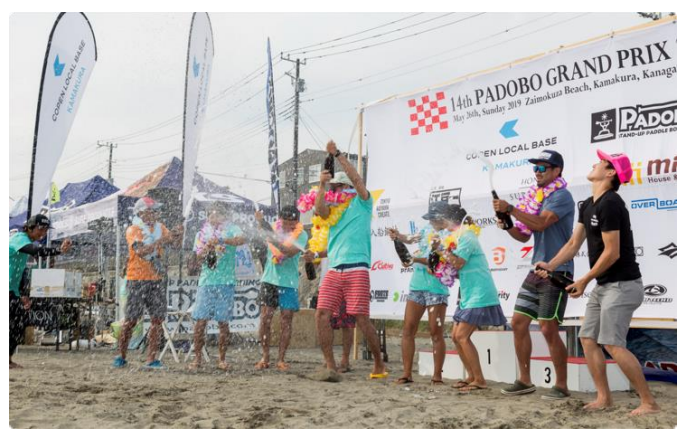
大会のフィナーレを飾るのは各クラスの優勝者による恒例のシャンパンファイト。