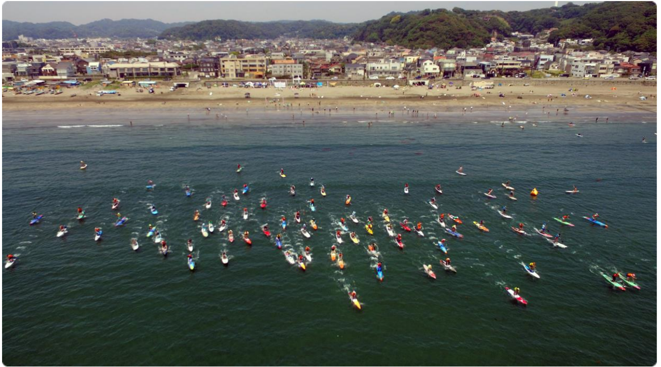
約 100 人が一斉にスタートするコースレースは大迫力